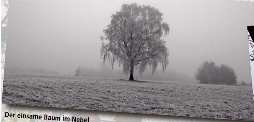
Der einsame Baum im Nebel...