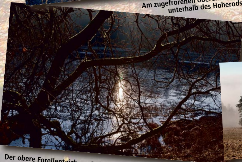
Der obere Forellenteich am Fuß des Hoherodskopf im ersten Sonnenlicht...