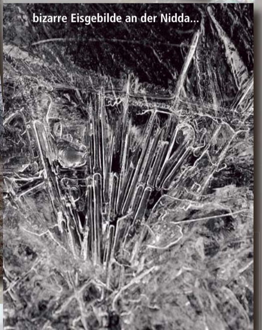
bizarre Eisgebilde an der Nidda...