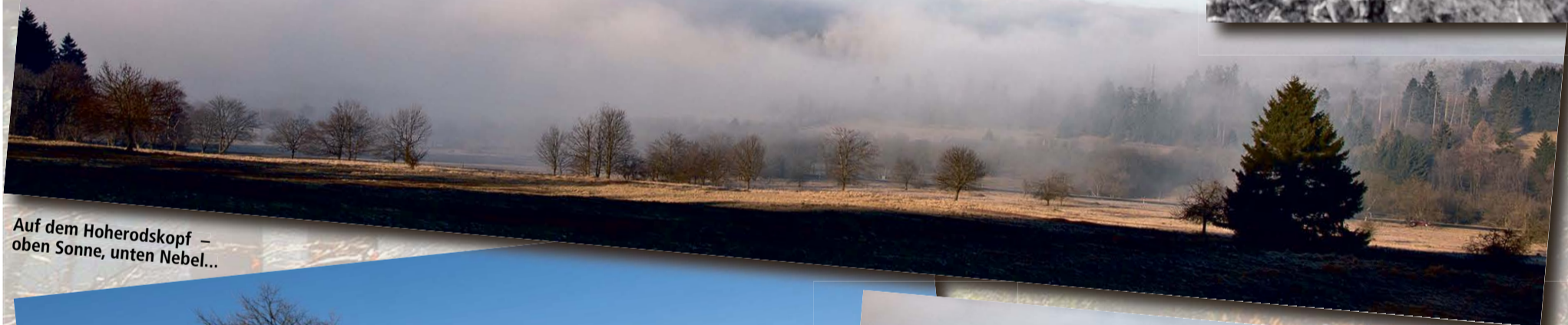
Auf dem Hoherodskopf – oben Sonne, unten Nebel...