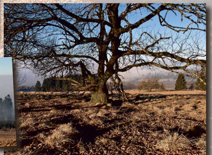
Uralte knorrige Baumriesen am Hoherodskopf...