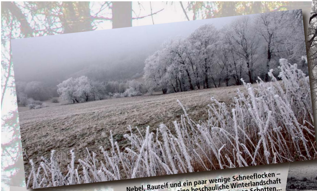
Nebel, Raureif und ein paar wenige Schneeflocken – eine beschauliche Winterlandschaft in der Nähe von Schotten...