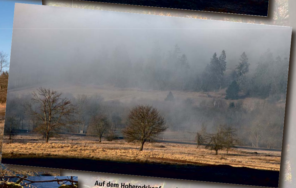
Auf dem Hoherodskopf – zwischen Sonne und Nebel...