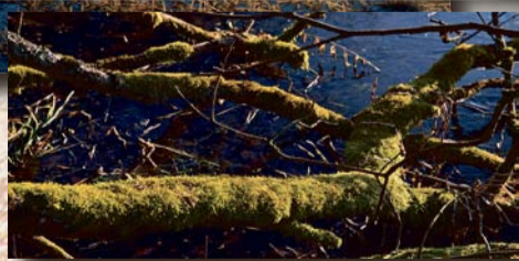
Leuchtendes Moos in der tiefstehenden Wintersonne...