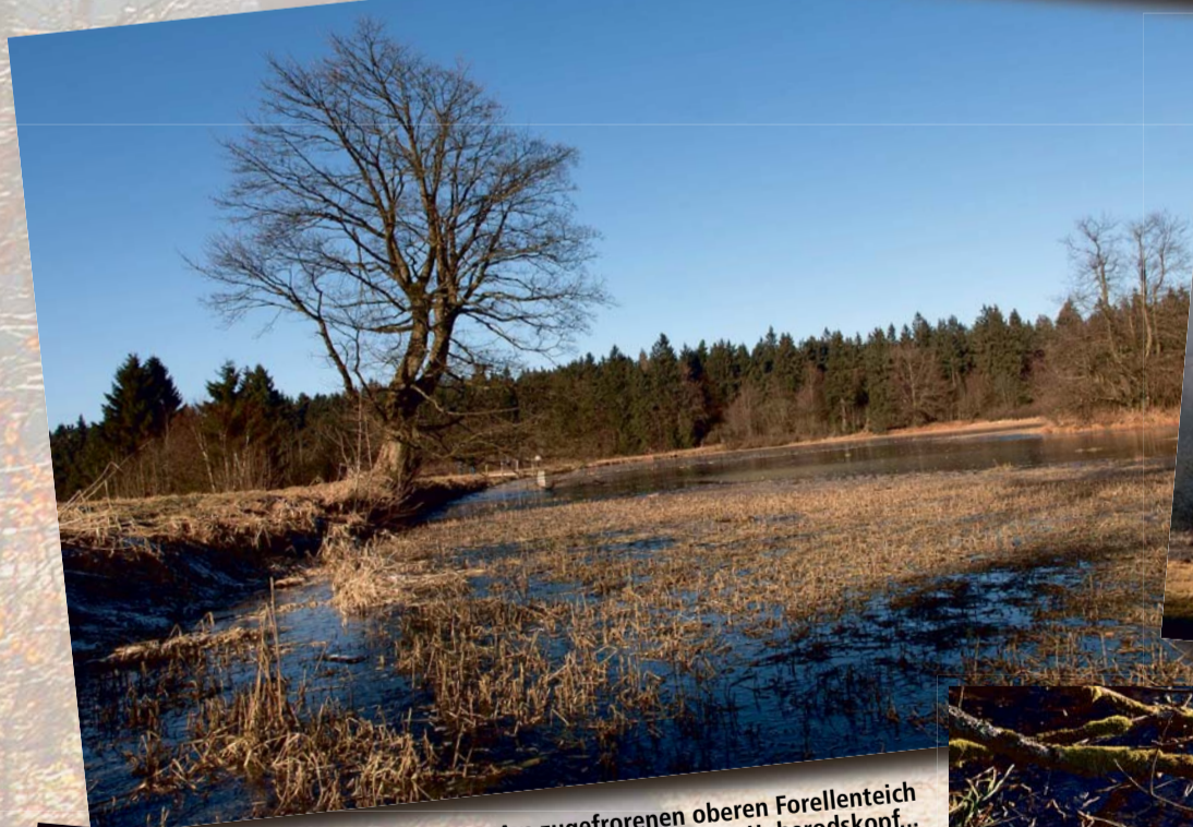
Am zugefrorenen oberen Forellenteich unterhalb des Hoherodskopf...