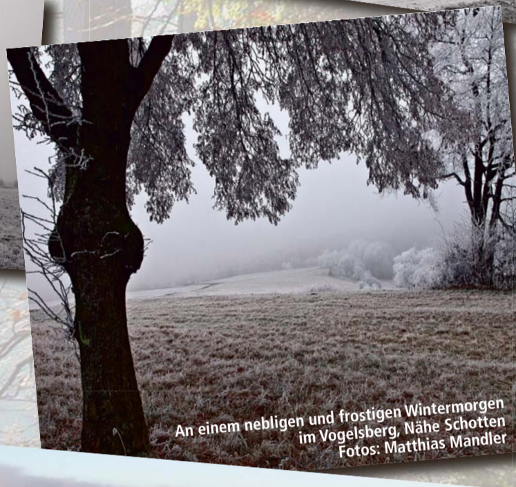
An einem nebligen und frostigen Wintermorgen im Vogelsberg, Nähe Schotten