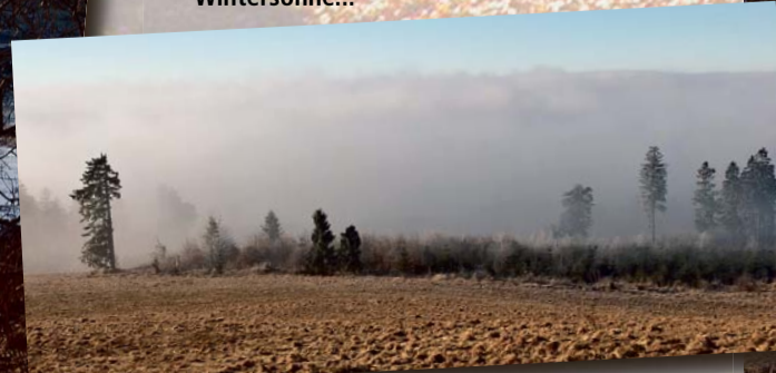
Über dem Nebel – Winter am Hoherodskopf...