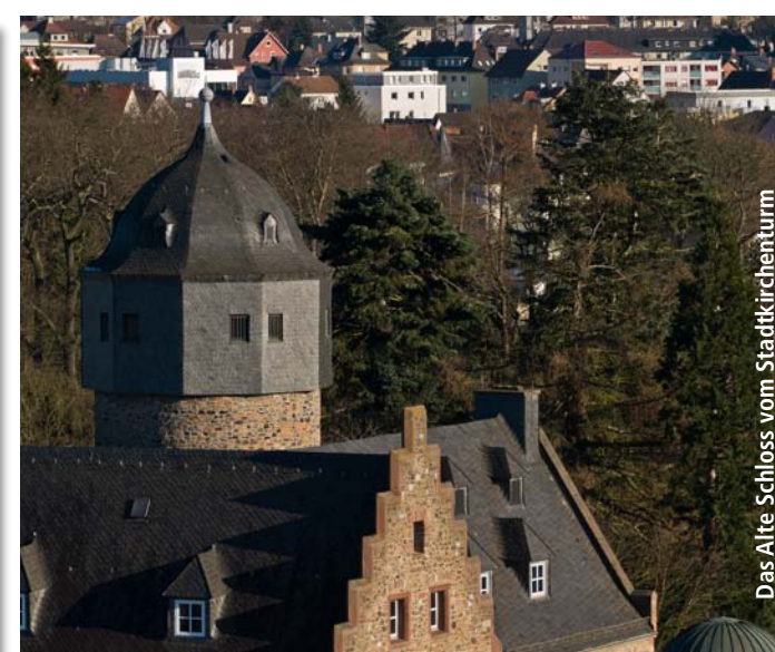
Das Alte Schloss vom Stadtkirchenturm