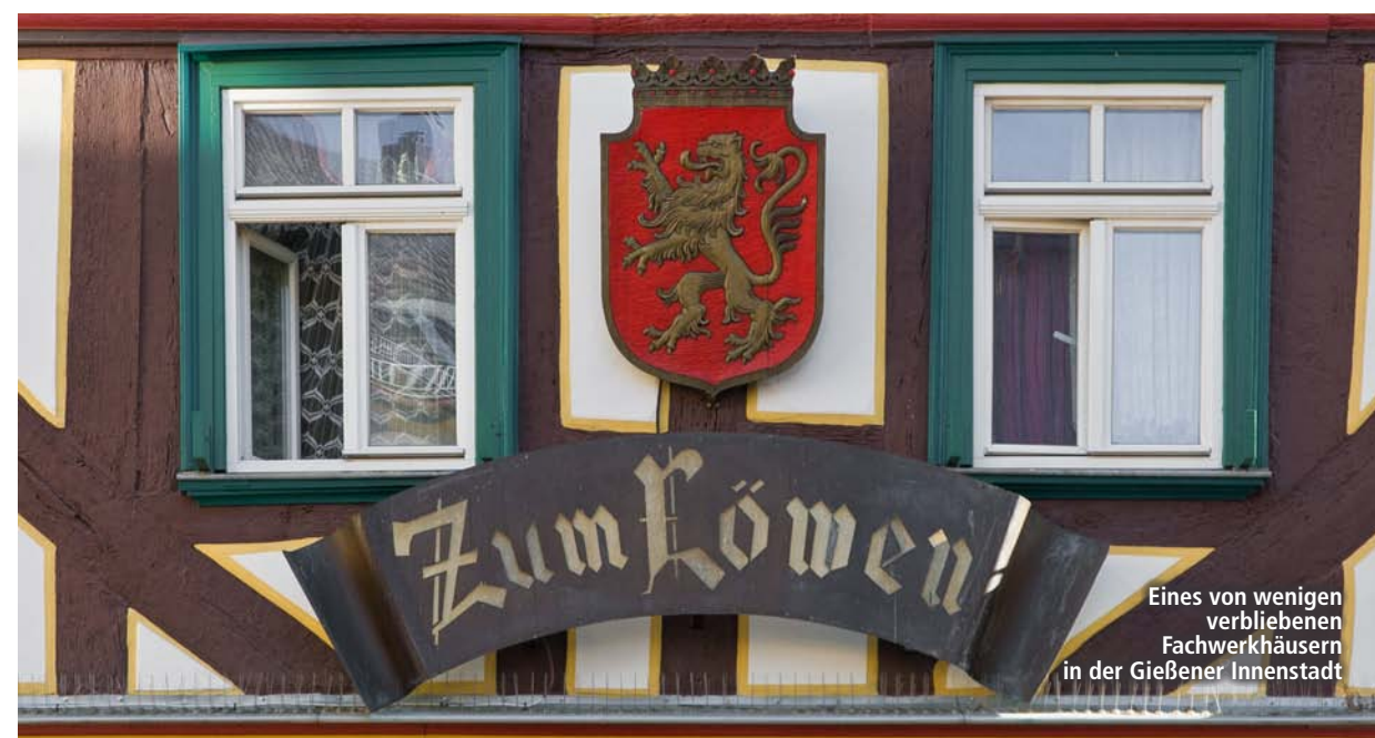
Eines von wenigen verbliebenen Fachwerkhäusern in der Gießener Innenstadt