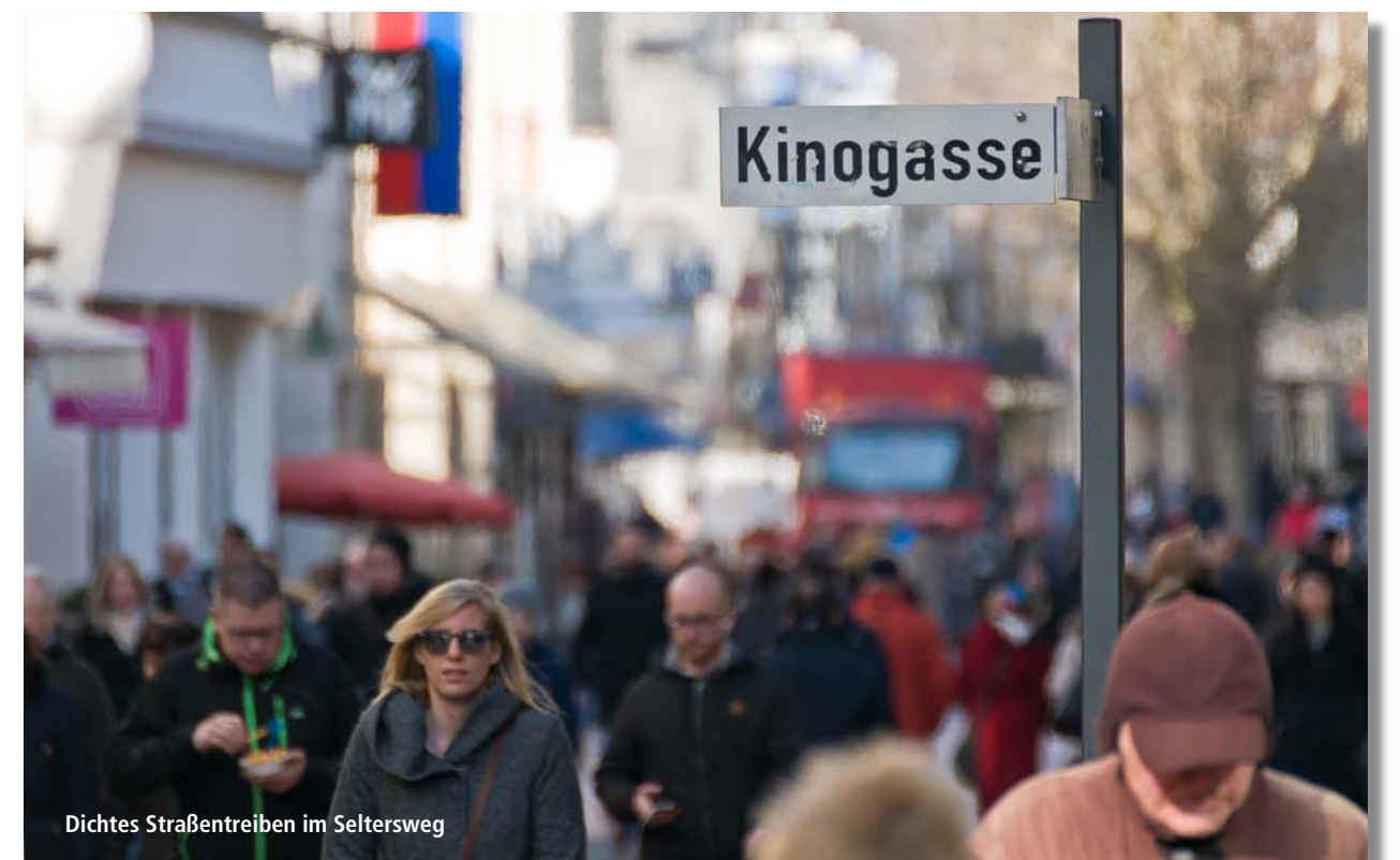
Dichtes Straßentreiben im Seltersweg