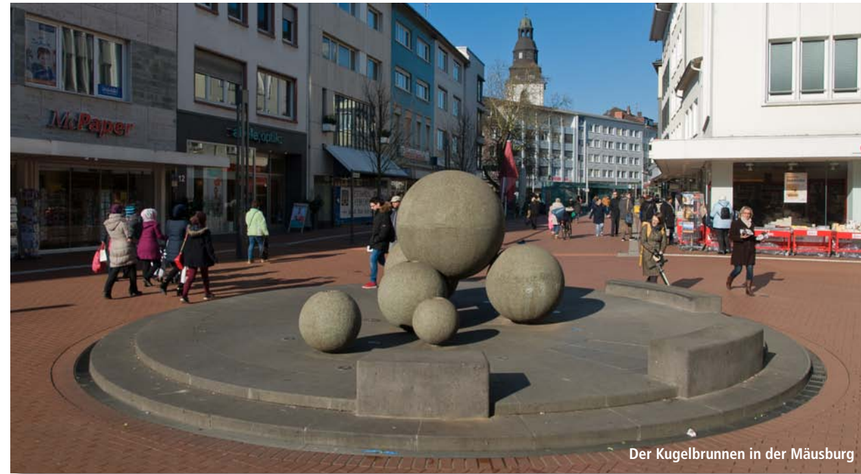
Der Kugelbrunnen in der Mäusburg