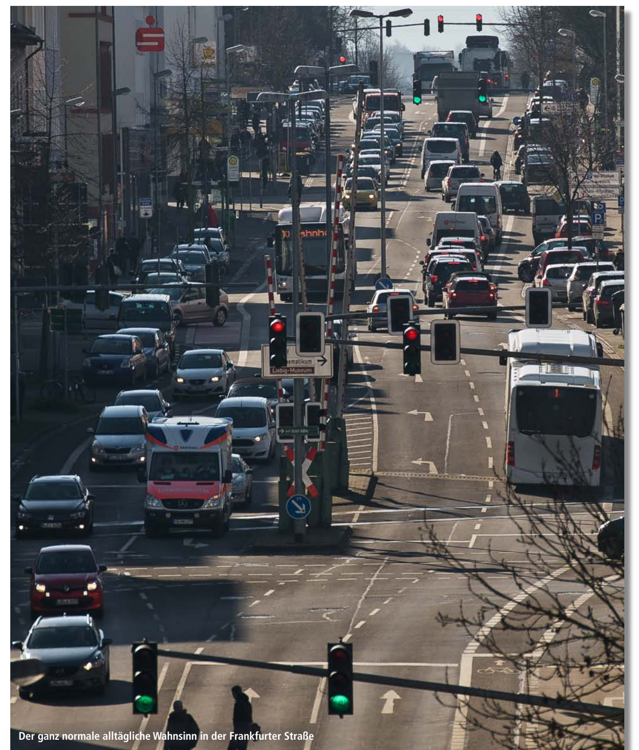
Der ganz normale alltägliche Wahnsinn in der Frankfurter Straße