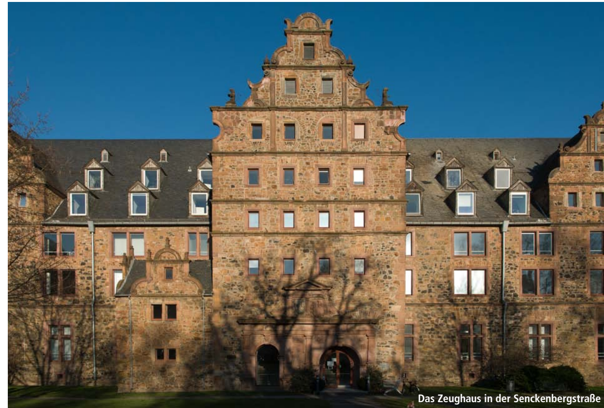
Das Zeughaus in der Senckenbergstraße