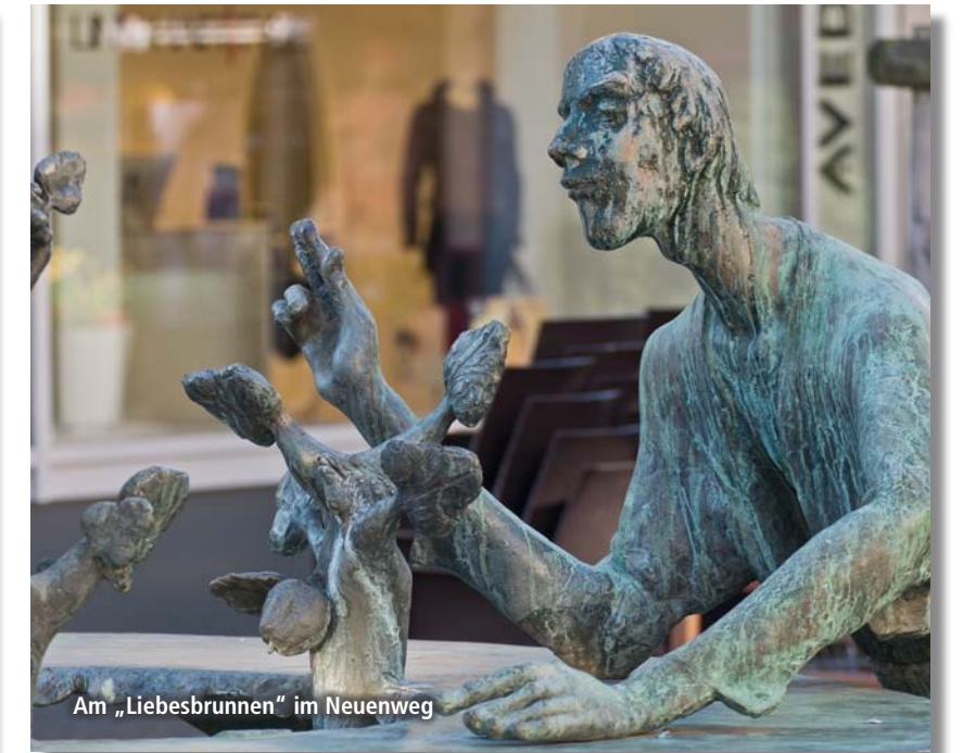
Am „Liebesbrunnen“ im Neuenweg